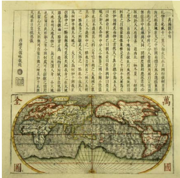
Document 5 : planisphère de Matteo Ricci, 1614

Matteo Ricci (1552-1610) est un missionnaire jésuite italien qui est un des premiers à avoir évangélisé la Chine. Il est un des Européens à avoir le plus adopté le mode de vie chinois afin de s'intégrer à la population. Il est reçu à la Cour impériale en 1601 et est enterré dans la Cité Interdite sur ordre de l'Empereur.